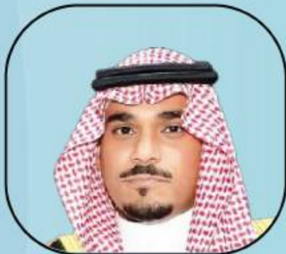
صاحب السمو الملكي الأمير تركسي بن هذلول ال سعود - حفظة الله - نائب أمير منطقة نجران