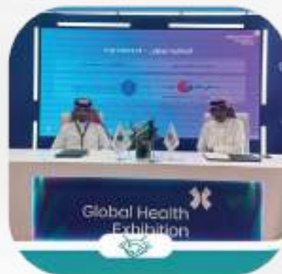
اتفاقية مع مستشفى الطاهر