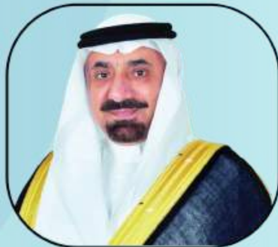
صاحب السمو الأمير جلوي بن عبد العزيز بن مساعد - حفظة الله - أمير منطقة نجران