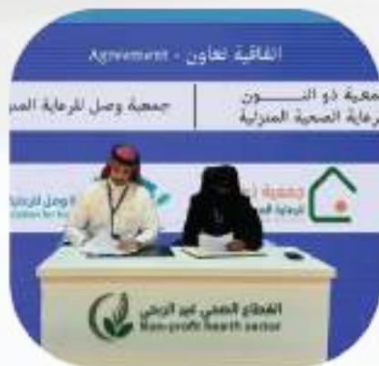
اتفاقية مع جمعية ذو النون لرعاية الصحة المنزلية