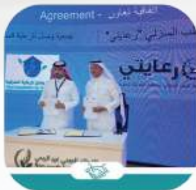
اتفاقية مع جمعية الطب المنزلي بمنطقة المدينة المنورة (رعايتي)