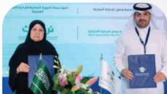
اتفاقية مع المؤسسة الخيرية الوطنية للرعاية الصحية المنزلية (نرعاك)