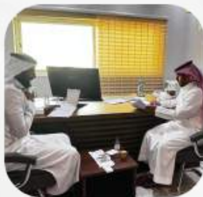
اتفاقية مع جمعية مسار للأطراف الصناعية والتأهيل