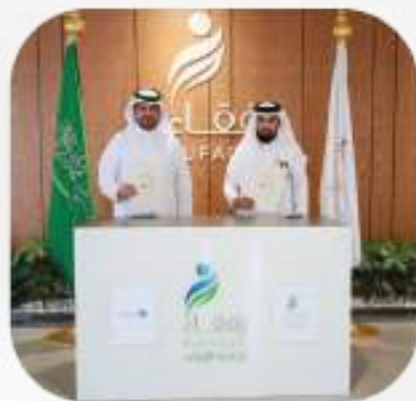
اتفاقية مع جمعية رفقاء لرعاية الأيتام